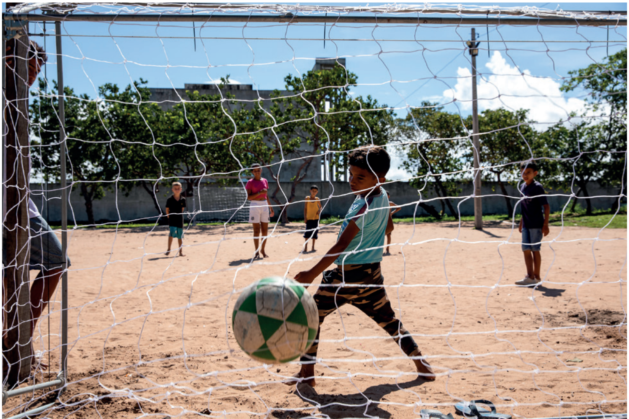
Boa Vista/RR: Os centros de acolhida contam com atividades protetivas e de recreação para todas as idades.