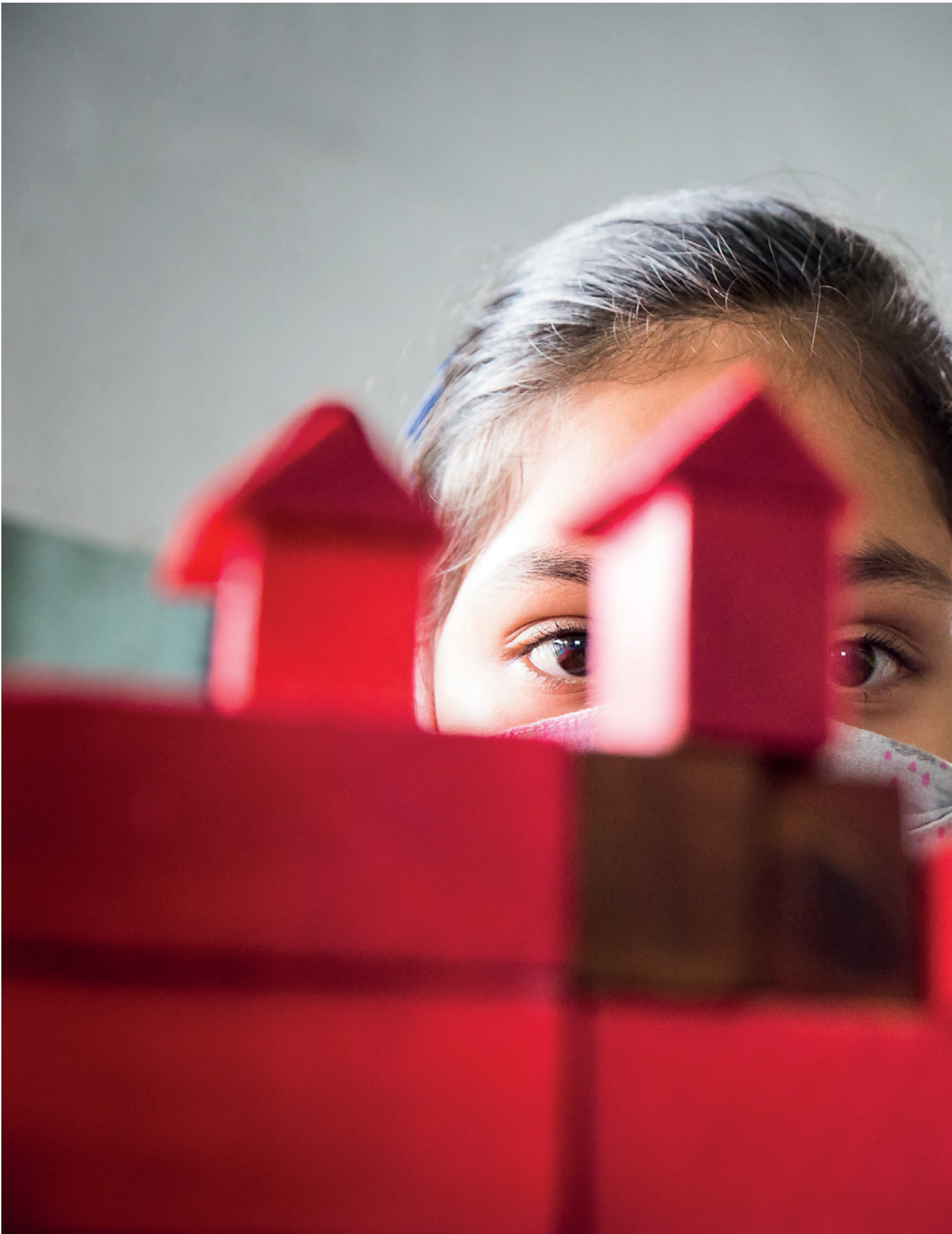
Boa Vista/RR: Os centros de acolhida contam com atividades protetivas e de recreação para todas as idades.