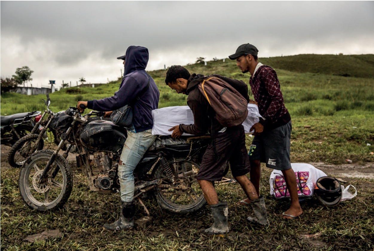
La Gran Sabana (Venezuela): “Los coyotes”, pessoas que levam produtos e organizam o deslocamento de grupos de migrantes entre a fronteira.

De 2016 até hoje, estima-se que mais de 600 mil venezuelanos tenham migrado para o Brasil.