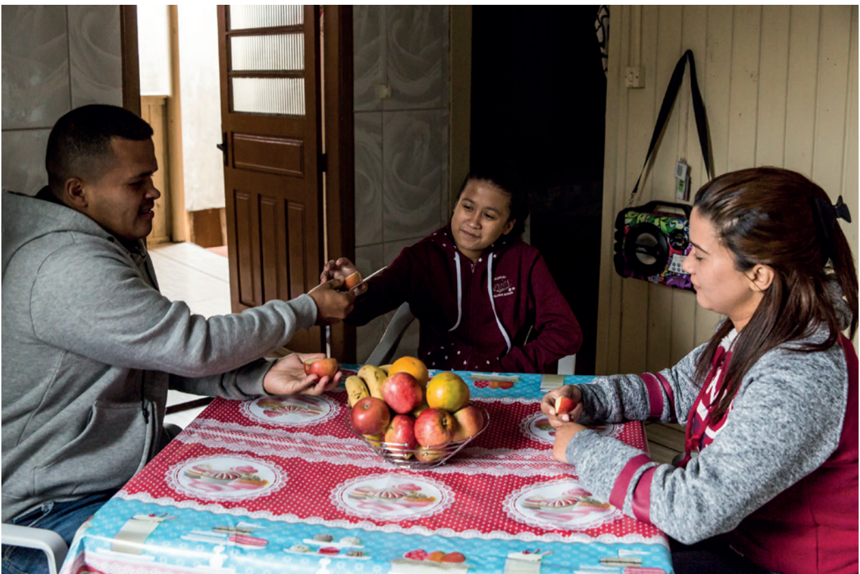
As famílias apoiadas pelo projeto Acolhidos contam com habitação temporária nos primeiros três meses. Desta forma, conseguem economizar seus proventos para a conquista da autonomia.