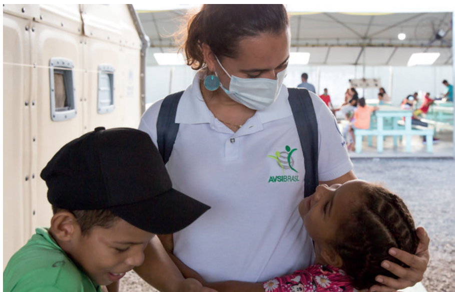
Os centros de acolhida de Boa Vista, Pacaraima e a Casa Bom Samaritano, em Brasília, abrigam refugiados e migrantes venezuelanos temporariamente.