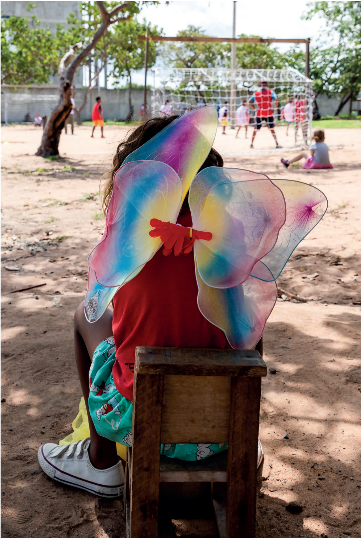
Criança fantasiada com asas coloridas em um dos centros de acolhida de Boa Vista/RR.