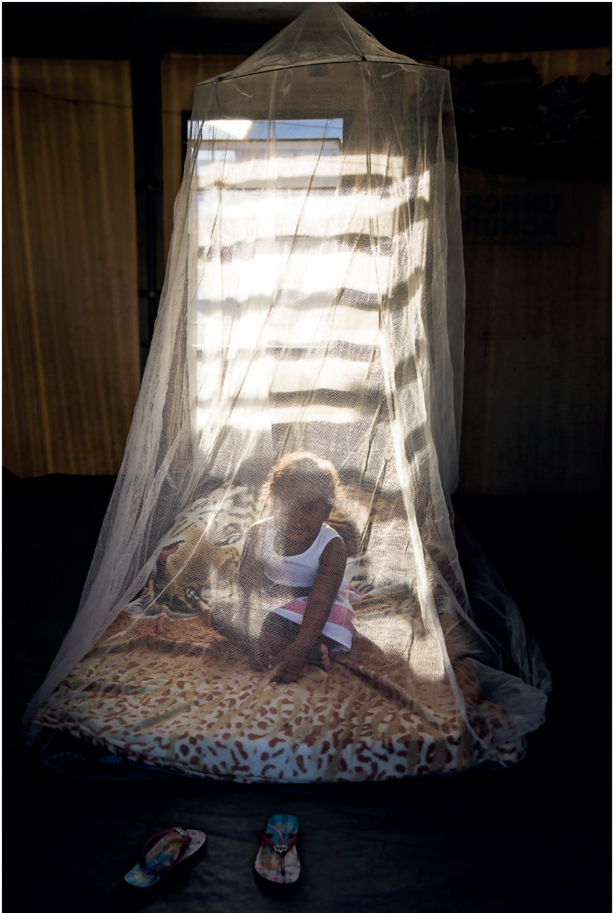
Bebê protegida com mosquiteiro em um dos centros de acolhida de Boa Vista/RR.