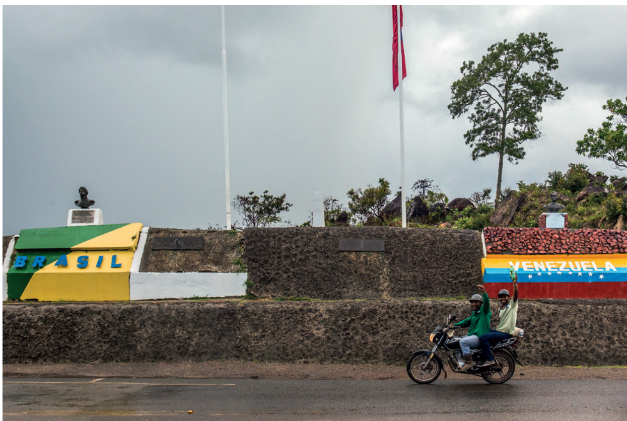
Venezuelanos entram no Brasil, passando pelo monumento fronteiriço em Pacaraima/RR.