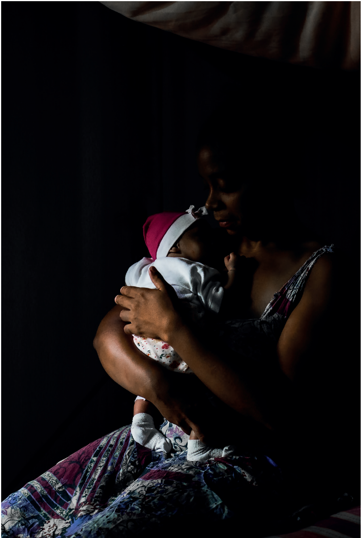
Mãe e filha recém-nascida, em um dos centros de acolhida de Boa Vista/RR.