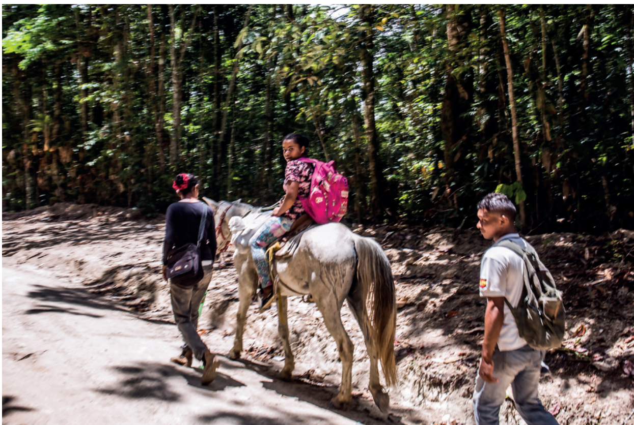
Nos períodos em que a fronteira é fechada, os venezuelanos percorrem pelas “trochas”, trilhas clandestinas.