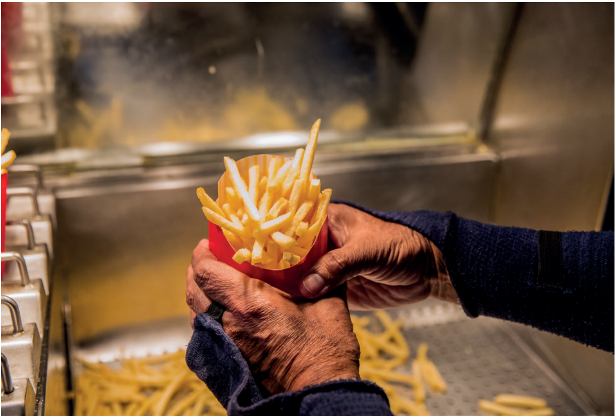
Migrante venezuelano trabalhando em restaurante fast-food, em Brasília/DF.

“O trabalho que a AVSI Brasil desenvolve se insere em uma ampla aliança, onde vários parceiros, com diferentes missões institucionais e responsabilidades, viabilizam um percurso de desenvolvimento integral de refugiados e migrantes venezuelanos. Cada pessoa é acolhida; curada; tem sua documentação regularizada e recebe ajuda para encontrar novos recursos e um novo lar para reiniciar a vida. Ela também é inserida no mercado de trabalho, graças a uma rede de empresas sensíveis a esta iniciativa.”