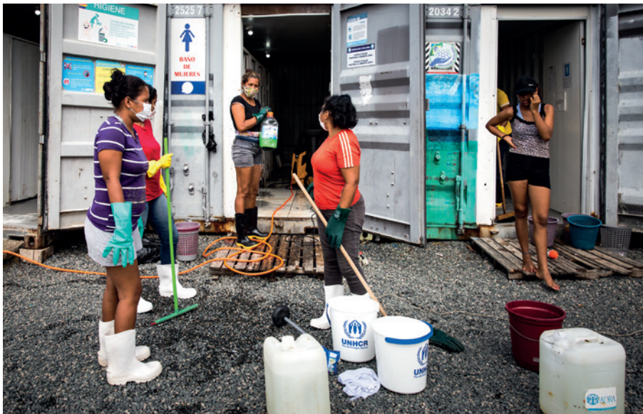
Os centros de acolhida de Boa Vista, Pacaraima e a Casa Bom Samaritano, em Brasília, abrigam refugiados e migrantes venezuelanos temporariamente.