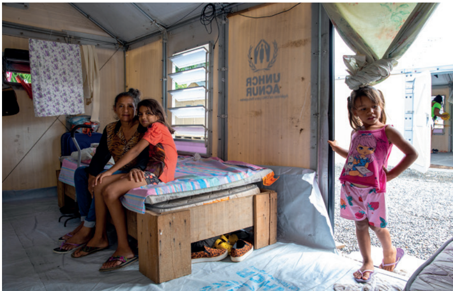
Os centros de acolhida de Boa Vista, Pacaraima e a Casa Bom Samaritano, em Brasília, abrigam refugiados e migrantes venezuelanos temporariamente.