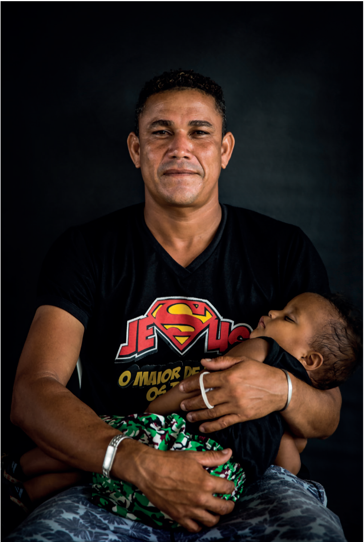
Famílias fotografadas nos centros de acolhida de Roraima e em cidades onde já foram integradas, em Santa Catarina e no Distrito Federal.