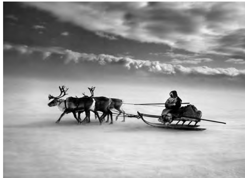
Nenet em seu trenó. Península de Yamal. Sibéria. Rússia. 2011.

Mal conseguimos ver o rosto desta pessoa, é um homem ou uma mulher? Os trenós maiores costumam ser conduzidos pelas mulheres e carregam os pertences das famílias do grupo, já os trenós menores, que são mais rápidos, são conduzidos pelos homens, para reunir as renas e caçar.