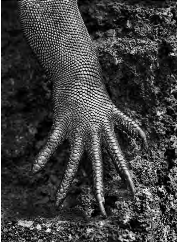
Iguana-marinha ( Amblyrhynchus cristatus ). Galápagos. Equador. 2004.

Poderia ser uma mão com dedos finos e unhas compridas, de luva. Ou seria uma pata? Mas de que bicho? Mãos humanas e patas de animais têm quantidade de dedos diferente.