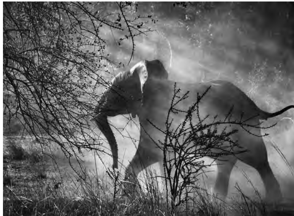
Elefantes ( Loxodonta africana ). Parque Nacional do Kafue, Zâmbia. 2010.

Perceba que nessa fotografia, a luz do sol projetada sobre a cena faz com que quase todos os elementos contidos nela se tornem silhuetas. Os galhos no primeiro plano estão pretos porque não recebem luz, já a orelha esquerda do elefante reluz sob o sol forte, enquanto mal conseguimos ver o desenho da orelha direita. As sombras têm variações de tons de cinzas até o preto, revelando alguns detalhes aonde alguma luz consegue chegar. A preferência de Salgado pela fotografia em preto e branco não nega suas origens nos “desenhos com luz” de Silhouette.