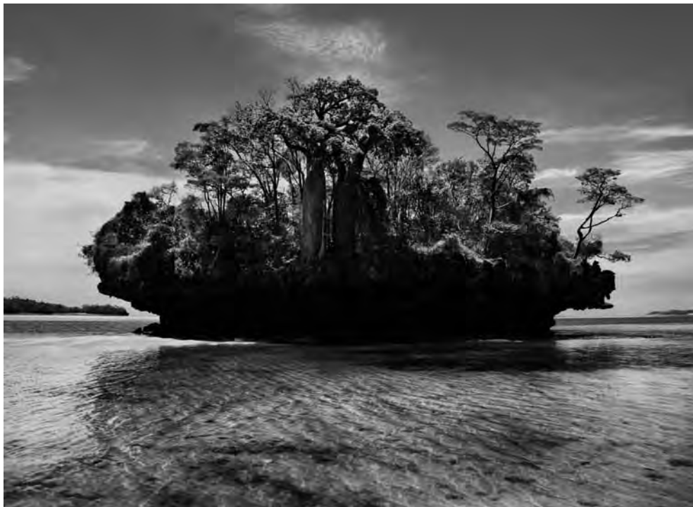
Árvores baobá ( Adansonia rubrostipa ) numa ‘ilha cogumelo’ na baía de Moramba, Madagascar. 2010.

O que lembra o formato dessa pequena ilha na baía de Moramba, em Madagascar? Um brócolis? Um cogumelo?