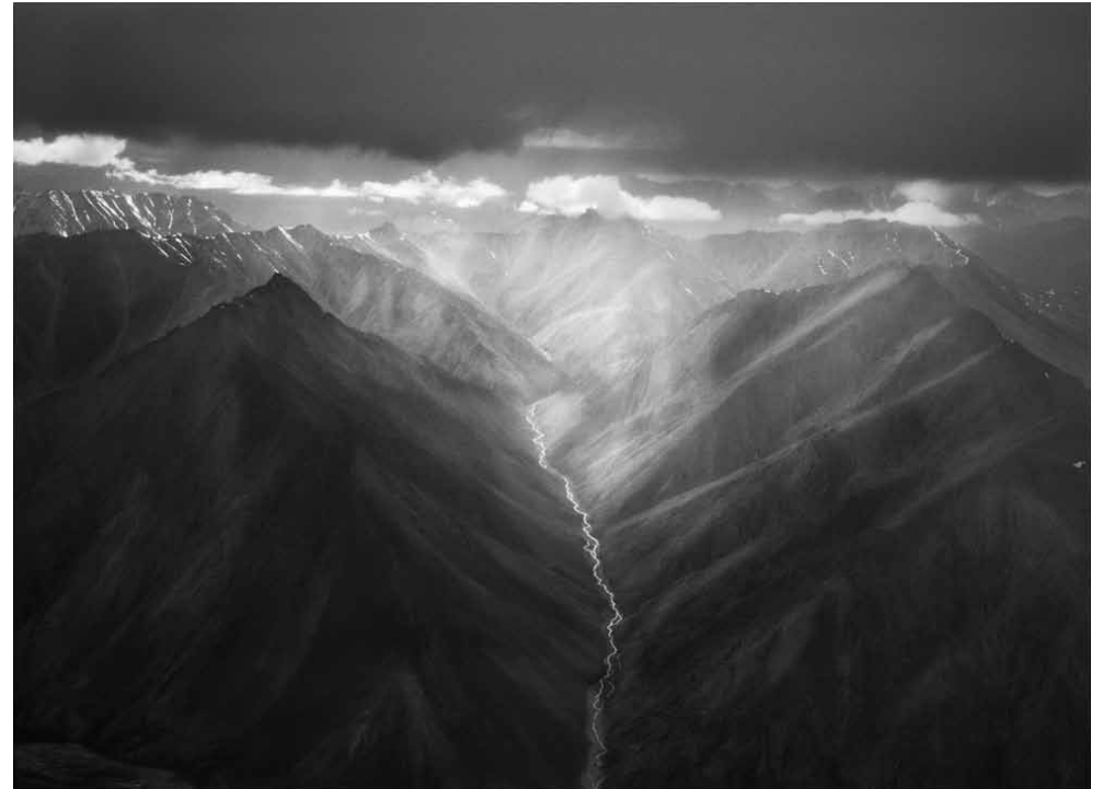
Cadeia de montanhas de Brooks. Alasca. EUA. 2009.