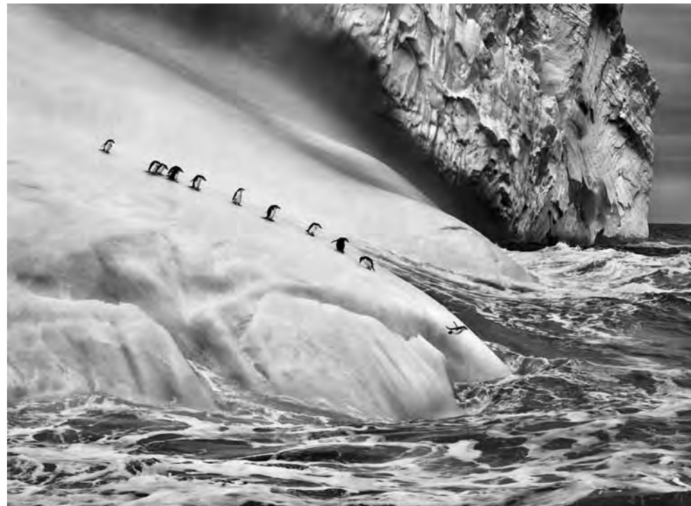
Pinguins-de-barbicha ( Pygoscelis antarctica ). Ilhas Sandwich do Sul, 2004.

Na segunda metade do século XVIII, não existia o cinema e a fotografia fora inventada há pouco, quando um fotógrafo inglês chamado Eadweard Muybridge teve a ideia de registrar como os corpos de pessoas e animais ficam durante o movimento. A olho nu não era possível ter certeza dos detalhes. Quem conseguiria desenhar como batem as asas de um pássaro durante o voo ou como ficam os nossos músculos durante um salto? Os pintores, por exemplo, tinham dificuldade em desenhar um cavalo a galope, porque ninguém sabia se o animal ficava com as quatro patas fora do chão ao mesmo tempo enquanto corria. Muybridge provou que sim, em 1877, quando fez uma sequência com mais de vinte câmeras e mostrou um cavalo galopando.