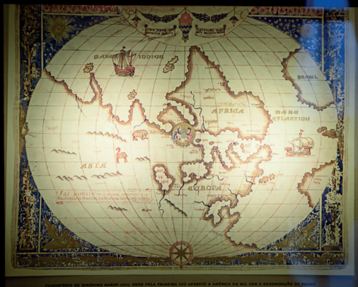
Rogério von Krüger

Fachada do Edifício BB – Rua Primeiro de Março, 66 – Rio de Janeiro, quarta sede do Banco do Brasil. Fotografia de 1906.