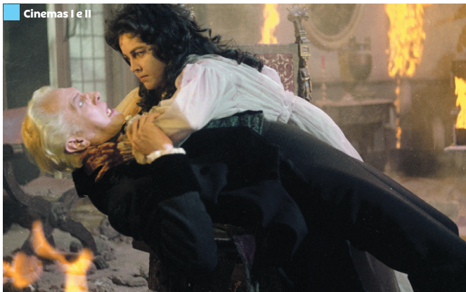
"O Solar Maldito"