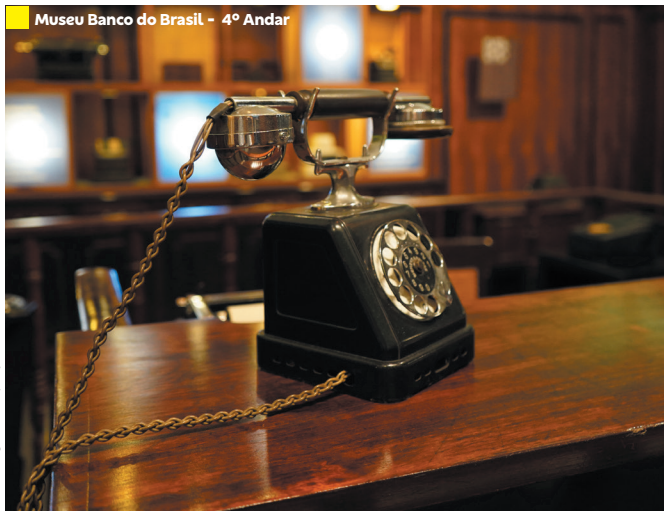
Sala da presidência do Banco do Brasil, 1926-1960. Cenário integrante da exposição "O BB e Sua História".