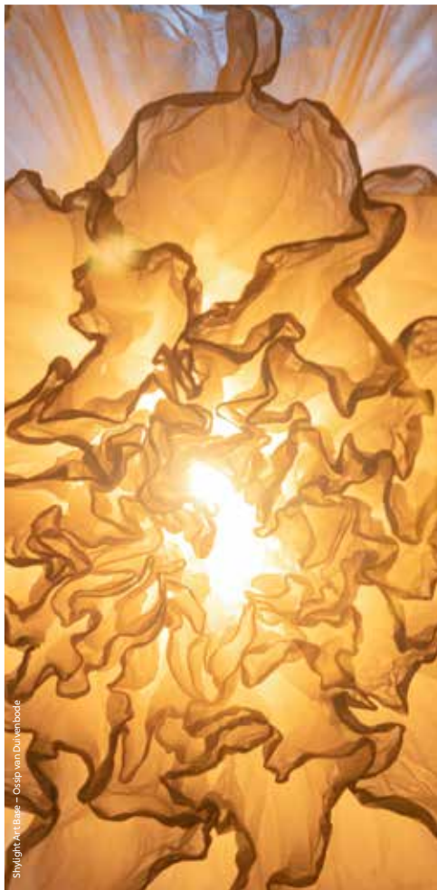
Shylight Art Base – Ossip van Duivenbode