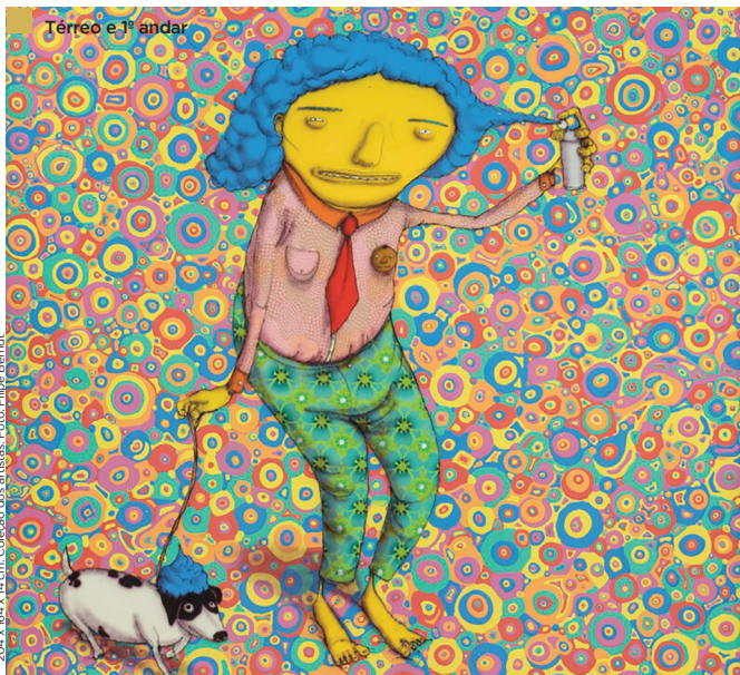
Cabelo onça, 2017 - Wave Hair, Tinta spray sobre madeira; 204 x 164 x 14 cm. Coleção dos artistas.