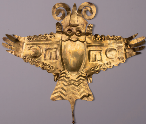
Penacho – Ouro 200 a.C. – 400 d.C. Cultura Nazca, Costa Sul do Peru