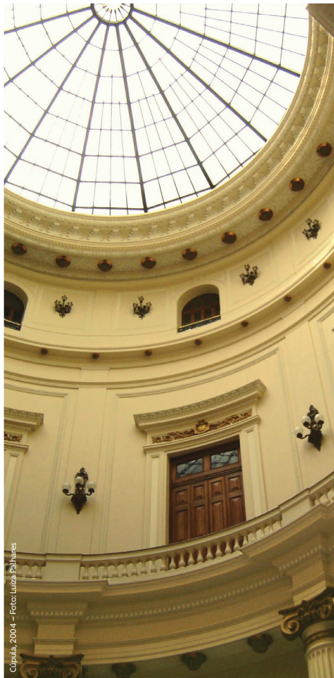
Cúpula, 2004