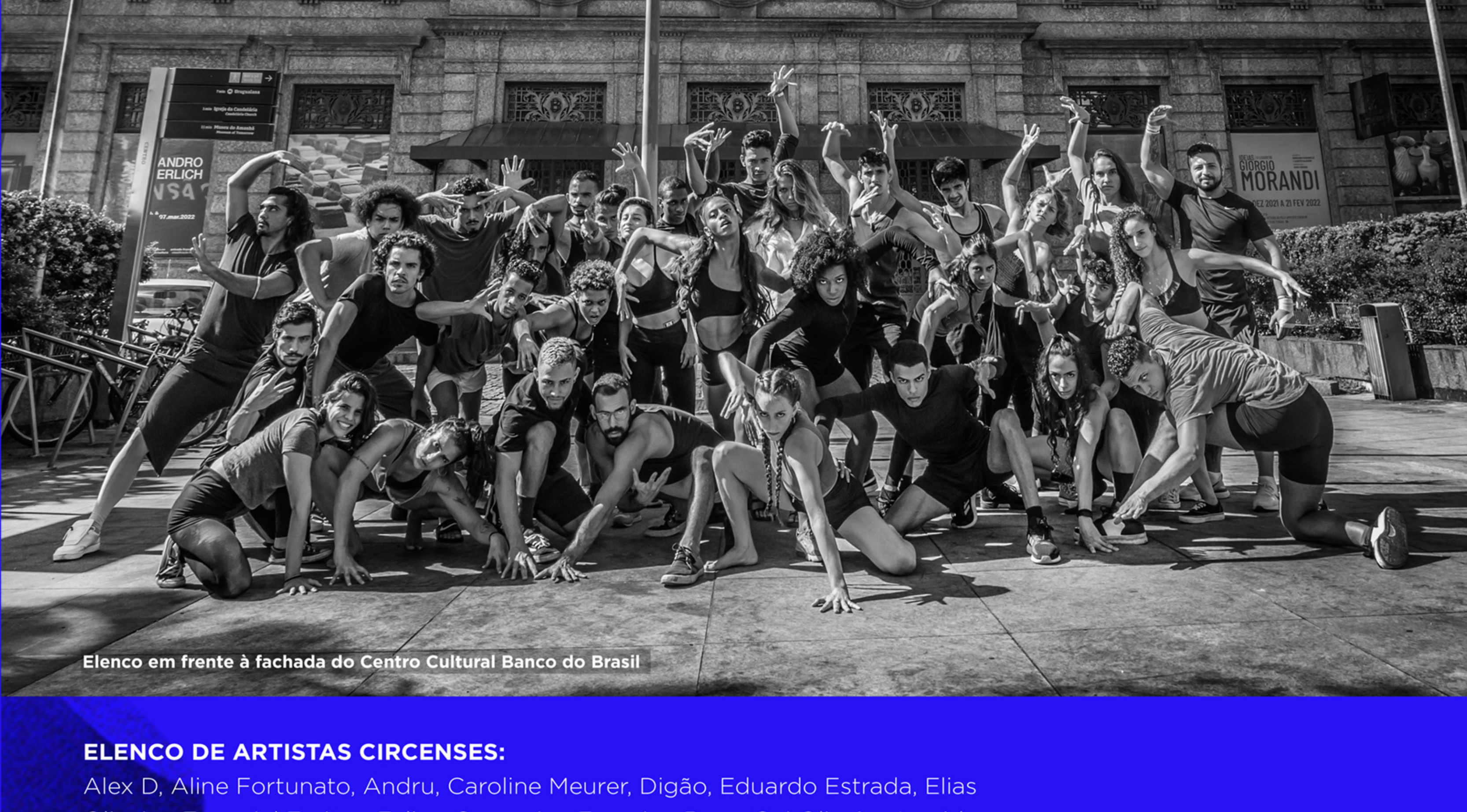
Elenco em frente à fachada do Centro Cultural Banco do Brasil