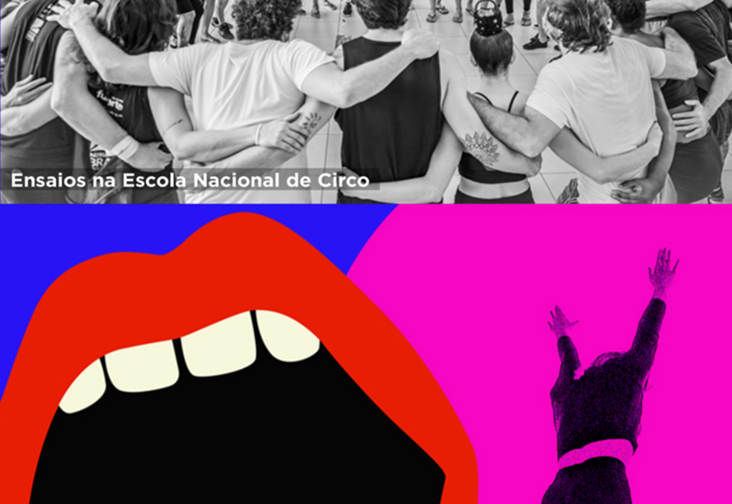
Ensaios na Escola Nacional de Circo