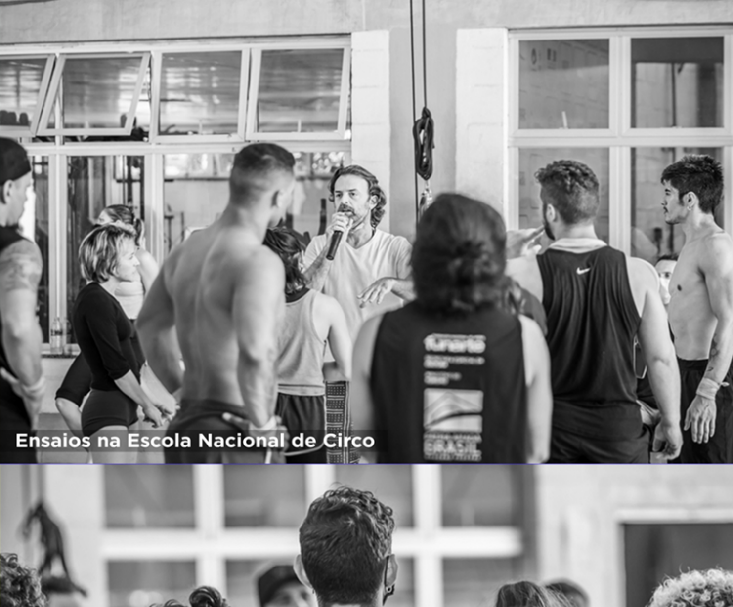
Ensaios na Escola Nacional de Circo