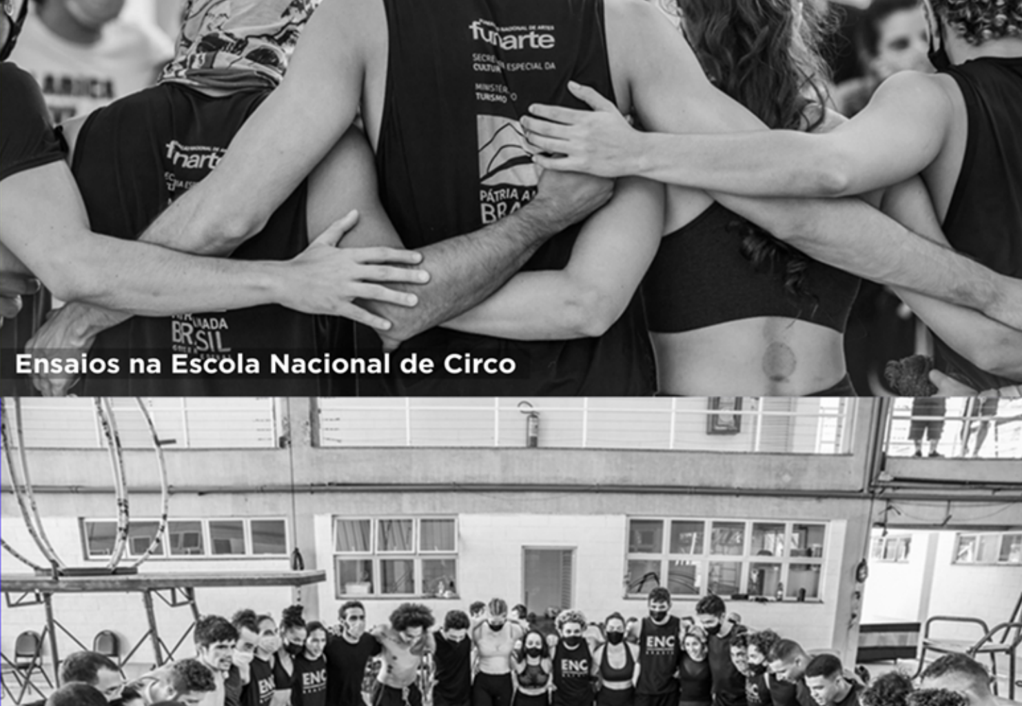
Ensaios na Escola Nacional de Circo